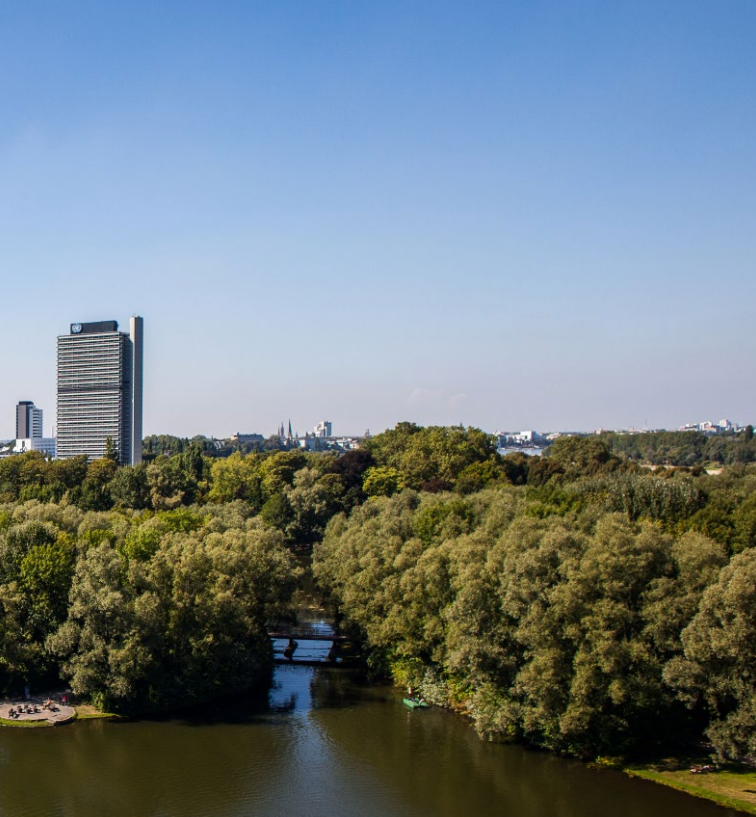
Le parc de la Rheinaue à Bonn

Campagne d'action en faveur des objectifs de développement durable des Nations Unies