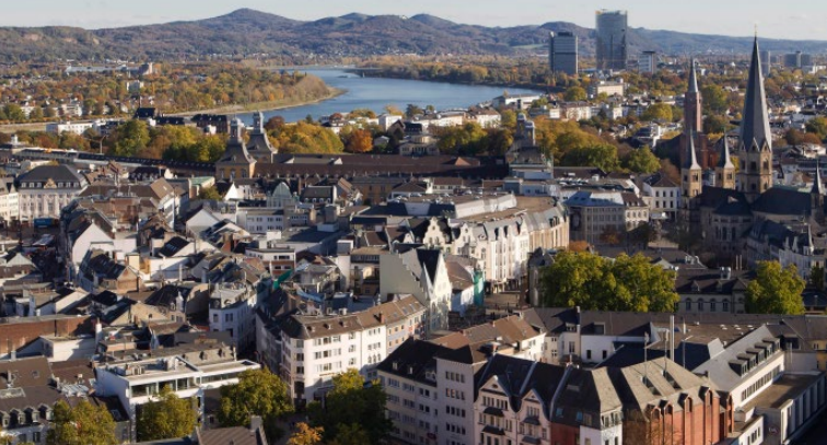
La ville de Bonn