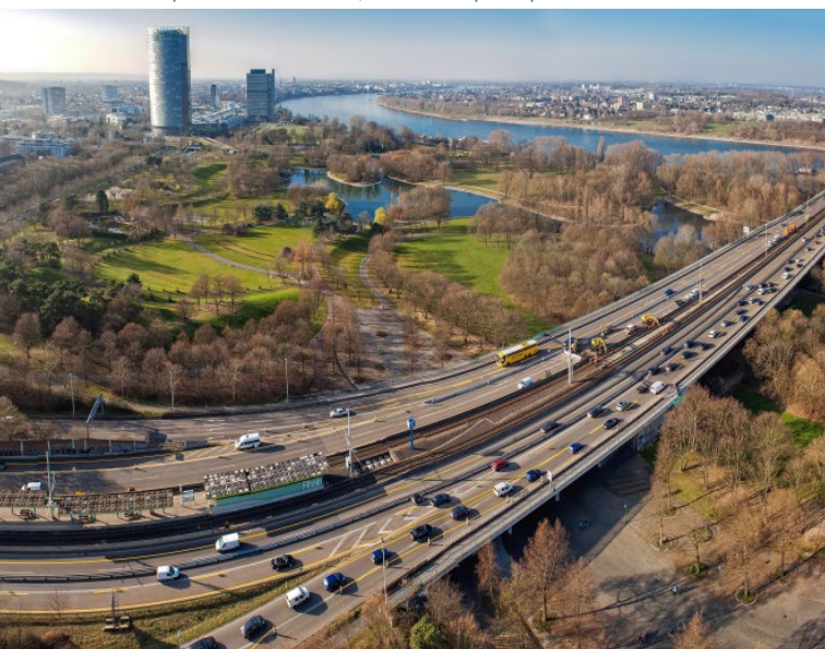
Le pont Konrad-Adenauer, l'un des trois ponts qui traversent le Rhin à Bonn

Après le déménagement du gouvernement et du Parlement à Berlin, la Ville fédérale a acquis un profil unique de centre de compétences pour la coopération internationale et le développement durable. Environ 1100 personnes employées par une vingtaine d'agences onusiennes travaillent sur le Campus des Nations Unies, non loin de la promenade qui longe le Rhin et avec vue sur la réserve naturelle vue sur la réserve du Siebengebirge. Elles agissent en lien étroit avec de nombreux acteurs du secteur du développement durable présents à Bonn, notamment des organisations internationales comme le Global Crop Diversity Trust