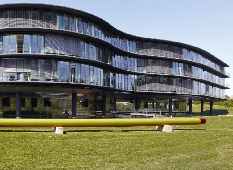
Caesar, Centre européen d'études avancées et de recherche, à Bonn

de plusieurs acteurs: le Réseau de Biodiversité de Bonn (BION). Il compte désormais près de 60 institutions membres et contribue à rapprocher différentes disciplines scientifiques et des institutions internationales, nationales et régionales renommées. Dans le domaine technique, on note la présence à Bonn du Centre aérospatial allemand (DLR). Il participe au fonctionnement du mécanisme d'alerte rapide d'UNISDR et à celui d'UN-SPIDER, le Programme des Nations Unies pour l'exploitation de l'information d'origine spatiale aux fins de la gestion des catastrophes et des interventions d'urgence. Enfin, Bonn abrite six instituts Fraunhofer ainsi que le Centre international pour la conversion (BICC).