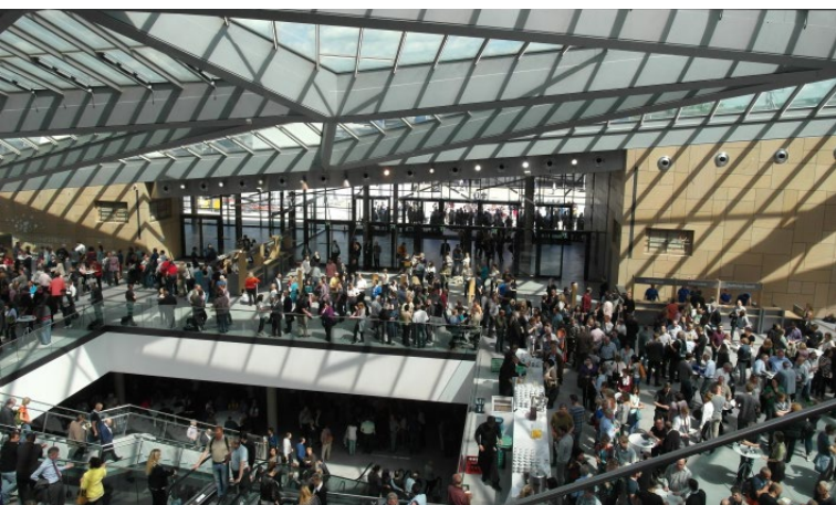
Site de conférences durable: le World Conference Center Bonn

née, le Forum mondial des médias de la Deutsche Welle attire des représentants des médias du monde entier.