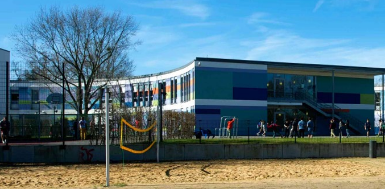
La Bonn International School