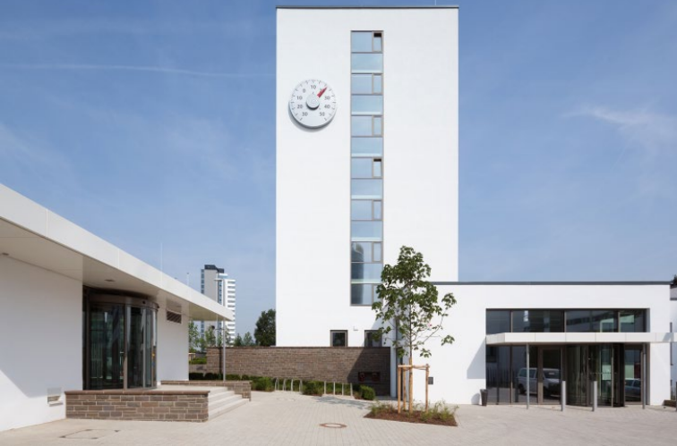
Campus des Nations Unies: siège de la CCNUCC

Au-delà du travail quotidien des Nations Unies et de ses partenaires, son rôle de ville hôte de conventions et de rencontres fait de Bonn un acteur majeur sur la scène internationale du développement durable. C'est ici que se rencontre la communauté internationale pour des conférences dédiées aux grands défis du futur comme la biodiversité, la protection du climat et les énergies renouvelables.