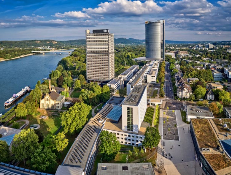
Le Campus des Nations Unies avec la Post Tower