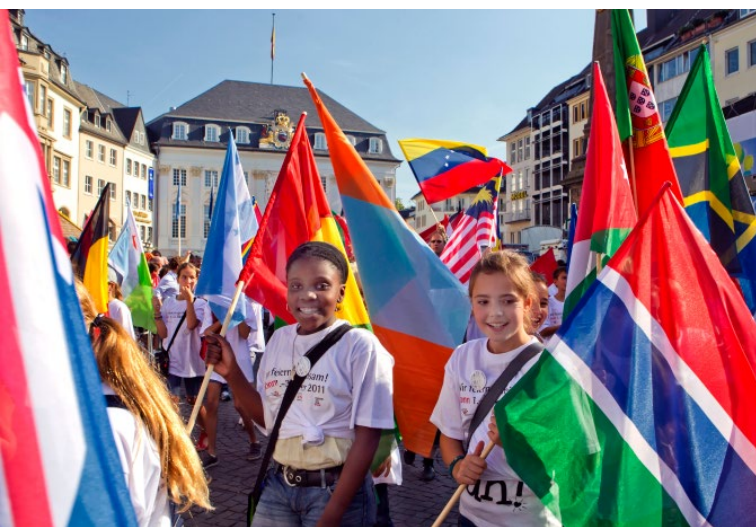
Différentes nations célèbrent la Journée des Nations Unies, face à l'Ancien hôtel de ville

avec l'Université de Bonn et proposent des activités – comme la Nuit des sciences ou l'Université des enfants – pour favoriser chez les plus jeunes une passion pour les sciences.