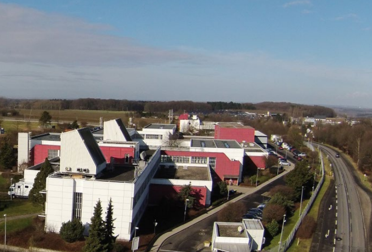
L'Institut Fraunhofer de la physique des hautes fréquences et des techniques radar (FHR), à Wachtberg près de Bonn

Nations Unies et l'existence d'une forte communauté dédiée au développement durable. Cela passe par la promotion de partenariats stratégiques entre acteurs de la recherche et d'autres domaines et l'organisation d'événements innovants pour valoriser ces partenariats.