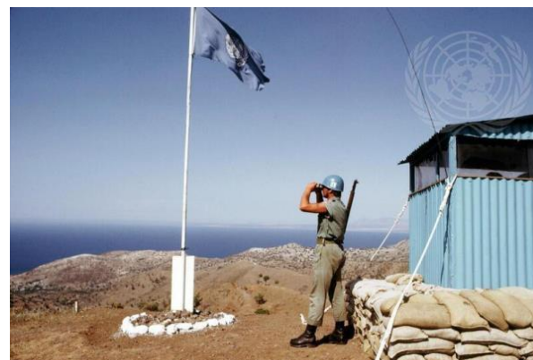
Força de Manutenção da Paz das Nações Unidas no Chipre (UNFICYP) durante o serviço de guarda) 1973

Estas missões multidimensionais foram concebidas para garantir a implementação de acordos de paz abrangentes e ajudar a construir as bases para uma paz sustentável.