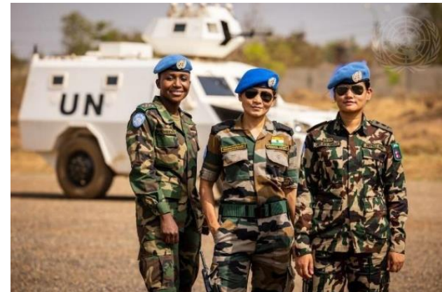
Mulheres das forças de manutenção da paz da Missão das Nações Unidas no Sudão do Sul (UNMISS) 2021

Ao longo dos anos, centenas de milhares de militares, dezenas de milhares de polícias da ONU e civis de mais de 120 países participaram nas operações de manutenção da paz da ONU.