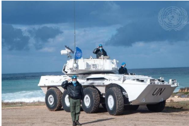
Forças militares de manutenção da paz ao serviço da Força Interina das Nações Unidas no Líbano (UNIFIL) 2021

Os soldados da paz (também conhecidos como "Capacetes Azuis") são mulheres e homens de vários Estados-membros (países) que ajudam os países a efetuar a difícil transição do conflito para a paz. Apesar de servirem sob a bandeira da ONU, os soldados de manutenção da paz não são soldados da ONU. Representam os seus Estados-membros e, normalmente, juntam-se como uma unidade integrante das forças armadas ou da polícia dos seus países de origem.