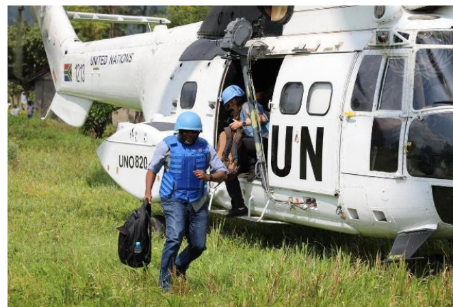
Missão de Estabilização da Organização das Nações Unidas na República Democrática do Congo (MONUSCO) 2021