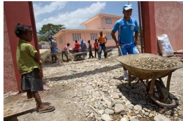
A Missão de Estabilização das Nações Unidas no Haiti (MINUSTAH) ajuda na renovação de uma escola local 2008

A natureza dos conflitos também mudou ao longo dos anos. A manutenção da paz da ONU foi originalmente desenvolvida para lidar com conflitos entre Estados, mas foram cada vez mais aplicadas a conflitos internos e guerras civis.