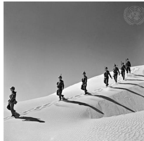
Força de Emergência da ONU na Península do Sinai, tropas jugoslavas em missão de patrulha 1957

Os Primeiros Anos: A manutenção da paz da ONU surgiu numa altura em que as rivalidades da Guerra Fria paralisavam frequentemente o Conselho de Segurança. A manutenção da paz limitava-se essencialmente à manutenção de cessar-fogos e à estabilização de situações no terreno, fornecendo um apoio crucial aos esforços políticos para resolver os conflitos pacificamente. Estas missões eram constituídas por observadores militares desarmados e tropas com armamento ligeiro, que tinham essencialmente como função supervisionar, reportar e estabelecer a confiança.