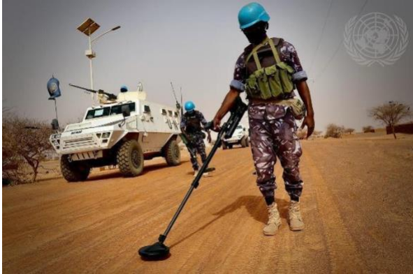
A Missão das Nações Unidas para a Estabilização do Mali (MINUSMA) inspeciona uma estrada (desminagem) no nordeste do Mali 2021

Os agentes de manutenção da paz da ONU eram agora cada vez mais solicitados para desempenhar uma grande variedade de tarefas complexas, desde o auxílio na criação de instituições sustentáveis de governação à monitorização dos direitos humanos, à reforma do setor da segurança, ao desarmamento, desmobilização e reintegração de antigos combatentes.