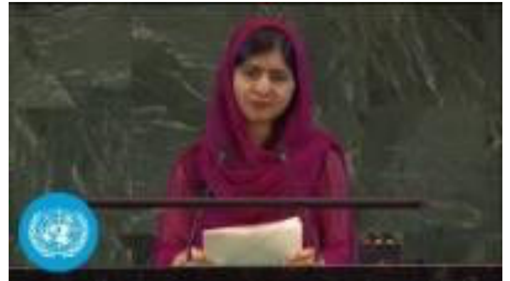
Discurso de Malala na Cimeira Transformar a Educação 2022